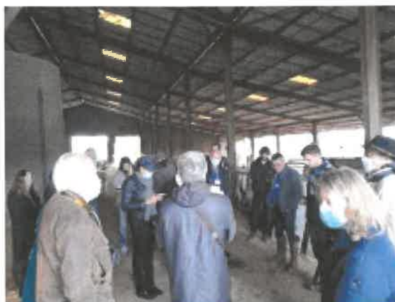
Visite d'une exploitation agricole (Neuvy St-Sépulchre) : agriculture, bocage et biodiversité

A la suite de cette visite, le bureau de la Fédération des PNR étudie le projet et rend son avis. Il en est de même du CNPN qui complète lui par une audition des porteurs du projet qui a eu lieu le 17 novembre en visioconférence.