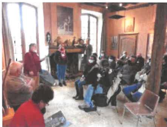
Visite du Château du Plaix (St-Hilaire en Lignières) : patrimoine immatériel et vivant berriçhon

En plus de la délégation, ce sont 52 intervenants locaux qui se sont mobilisés. Et nous en profitons pour les remercier de leur implication dans cette organisation.