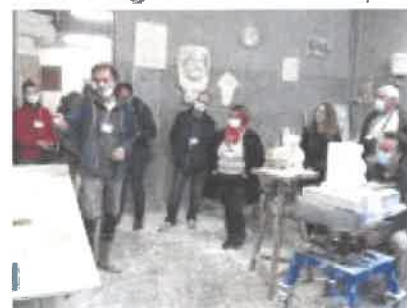
Visite du centre de formation FOREPABE (La Châtre) : métiers d'arts

Dans ce cadre, le territoire candidat doit organiser une visite de 2 jours à destination des rapporteurs nationaux . Celle-ci a eu lieu les 13 et 14 octobre 2020 . Une délégation locale composée des élus référents des Pays et de la Région accompagnés des techniciens référents a accueilli une délégation nationale de 7 personnes. Malgré une météo peu favorable et un planning chargé, la visite s'est bien déroulée. Elle comprenait 9 points d'arrêts (visites et temps d'échanges) permettant d'aborder différents thèmes : agriculture, bocage, biodiversité, problématique de l'eau, culture et éducation à l'environnement, économie autour de l'artisanat d'art, culture immatérielle berrichonne et biodiversité domestique, protection de sites naturels, développement touristique... A chaque arrêt il a été présenté les richesses, les fragilités, les enjeux et une discussion autour des plus-values possibles du PNR.