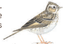
Alouette des champs

8 Le chemin vous ramène vers le bourg de Tranzault. Le plateau hésite aussi entre pâtures et cultures, ce qui permet au bruant jaune et à l'alouette des champs de trouver ici un espace pour nicher.