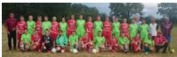
Equipe filles BVN/ POULAINES