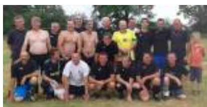
Equipe des anciens