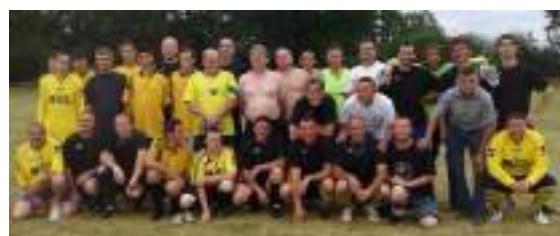
Equipe des anciens/ Equipe actuelle