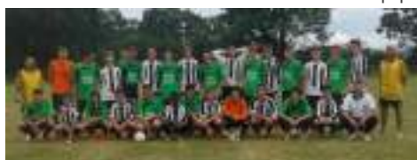
Equipe U18 de BVN/ BOICHAUT SUD