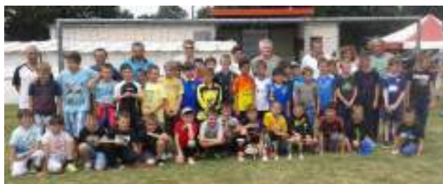
Equipe U11 qui a participé au tournoi