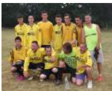
Equipe des jeunes