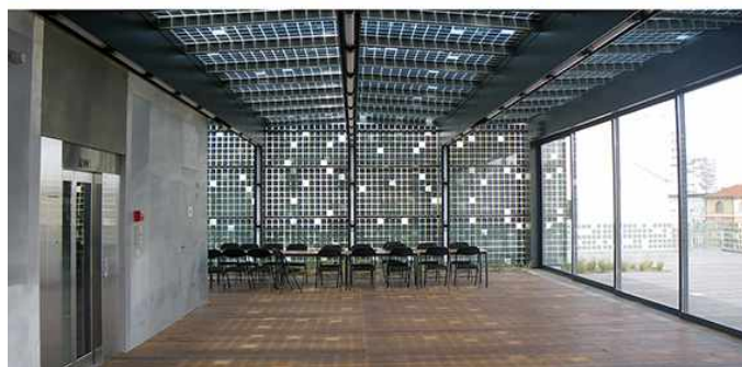
Ancienne sous-station de la compagnie parisienne de distribution électrique Emmanuel Saadi architecte

Les services territoriaux de l'architecture et du patrimoine (STAP) relèvent du ministère de la culture et sont chargés de promouvoir une architecture et un urbanisme de qualité, s'intégrant harmonieusement dans le milieu environnant. Unités territoriales de la direction régionale des affaires culturelles (DRAC) du Centre, les STAP sont implantés dans chaque département. Ils assurent le relais de l'ensemble des politiques relatives au patrimoine et à la promotion de la qualité architecturale, urbaine et paysagère du cadre de vie dans une perspective d'aménagement durable des territoires.