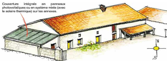
Couverture intégrale en panneaux photovoltaïques ou en système mixte (avec le solaire thermique) sur les annexes.