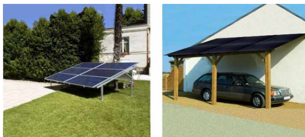
Implantation des panneaux solaires au sol ou sur appentis

Les capteurs solaires destinés à être implantés en toiture sont constitués de modules qu'il convient de positionner en accord avec l'aspect général du bâtiment et avec les caractéristiques de l'environnement existant.