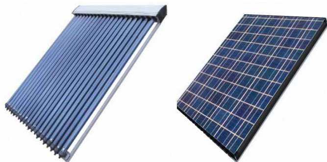
Capteurs solaires thermiques et photovoltaïques

Les techniques de mise en œuvre des panneaux photovoltaïques permettent d'envisager des projets intégrés à des espaces bâtis préexistants. Selon les contextes, on privilégiera l'implantation de panneaux dans le plan de la toiture, les capteurs souples, les vitrages mixtes ou les tuiles solaires.