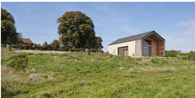
DRAC Centre - Fiche conseil « Construire une maison individuelle » Mise à jour : décembre 2013

Tout projet dont le traitement en rupture avec les caractéristiques environnantes serait de nature à altérer la cohérence de l'environnement constitué pourra être refusé ou faire l'objet de prescriptions spéciales en application de l'article R111-21 du code de l'urbanisme.